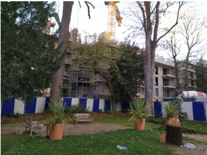
Parc Bourdeau en 2021 pendant les travaux

Lors de la réunion en Mairie du 1 er février 2023, l'ASPEA a fait part de son inquiétude quant à l'état des arbres côté « Villa parc Bourdeau ».