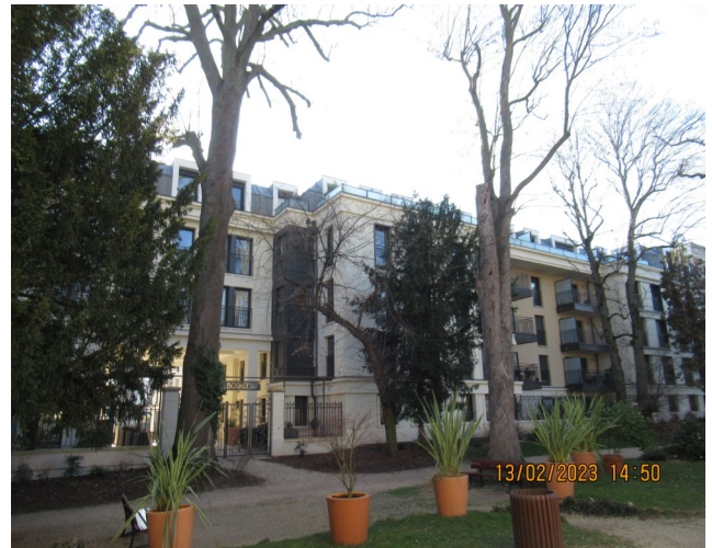
Photo dans le même axe février 2023

Nous déplorons la mutilation des deux plus beaux arbres du parc et la destruction du charme de ce petit parc depuis la construction de cette imposante résidence – plus de vue sur le ciel pour les personnes empruntant ce parc.